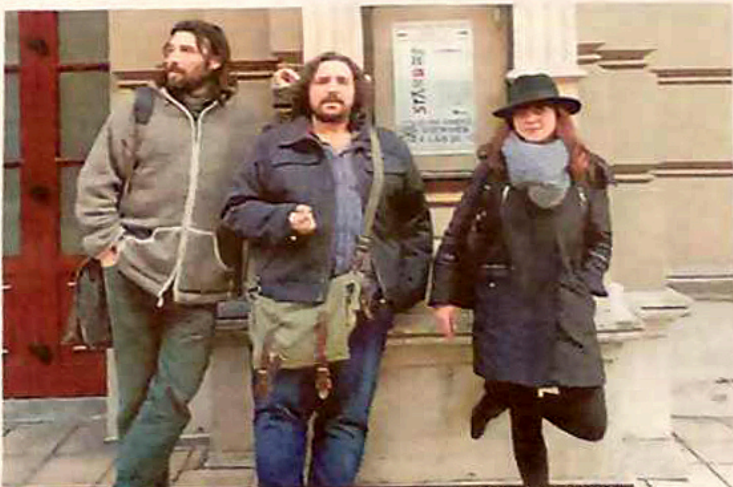
Los protagonistas del teatro de hoy en Avilés, ante la puerta del Palacio Valdés.

piezas de Nacho Vegas o Soleá Morente o tangos de despedida como 'Adiós, muchachos'. «En ocasiones, la letra y la música subrayan los acontecimientos de la trama, y en