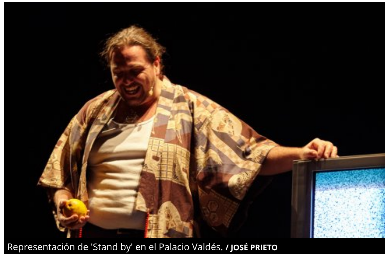
Representación de 'Stand by' en el Palacio Valdés.

La obra del ex-director de la ESAD -un musical con soporte de tragicomedia- abordó la cuestión de los refugiados desde un punto de vista original